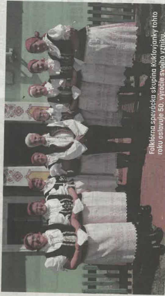
Folklórna spevácka skupina Kuklovjanky tohto roku oslavuje 50. výročie svojho vzniku.